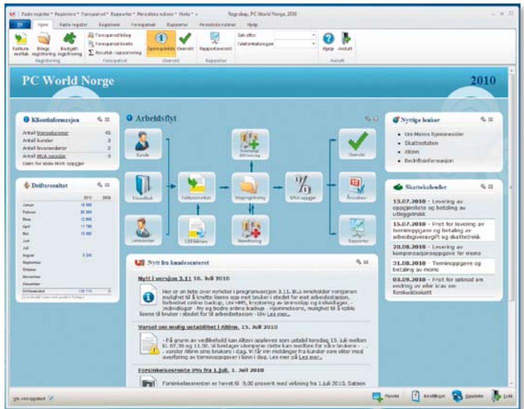
Åpningsbildet i Uni Økonomi kan fritt tilpasses og gir deg oversikt over hele programmet.

Hvis du ikke liker fakturablan- ketten til Uni, kan du ta en kopi